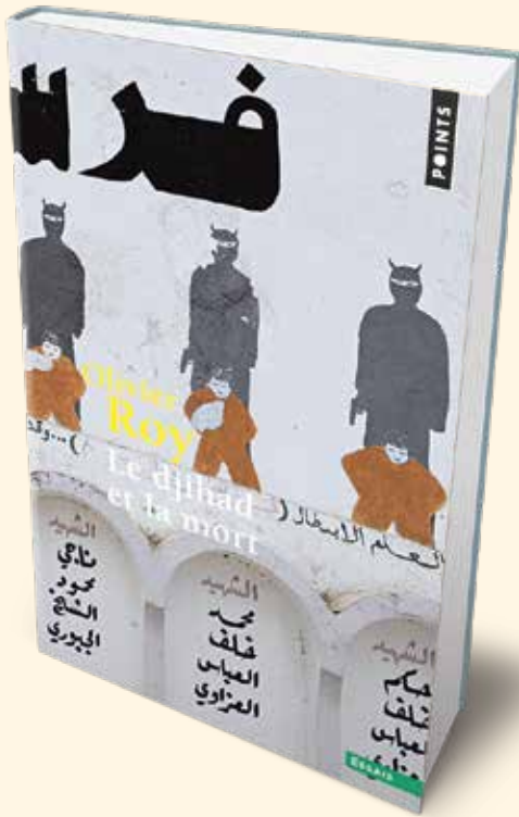
▲ نسخه فرانسوی کتاب جهادگرایی و مرگ

به نظر می‌رسد ایده اصلی کتاب این باشد که مرگ برای یک داعشی انتحاری از هر چیزی مهم‌تر است، و این ایده‌ای است که روآ تلاش می‌کند در جای جای کتاب خود بدان بپردازد.